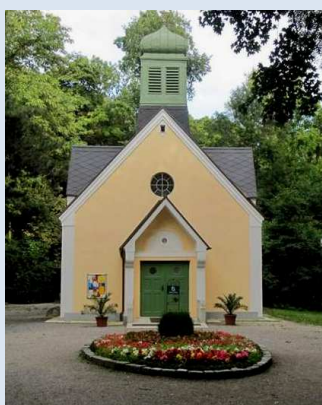
Wallfahrt Maria Grün