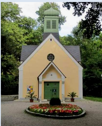
Wallfahrt Maria Grün

Zum Kennenlernen: Zwei besondere Wallfahrtsorte, die wir im Rahmen einer Kulturfahrt besuchen werden